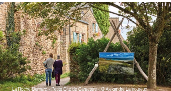
La Roche-Bernard - Petite Cité de Caractère

Avec une approche très inclusive, une double promesse est faite au visiteur : une expérience de tourisme culturel et durable, et une immersion le temps d'une visite dans cet art de vivre « à la Française », baigné de culture et de patrimoines.