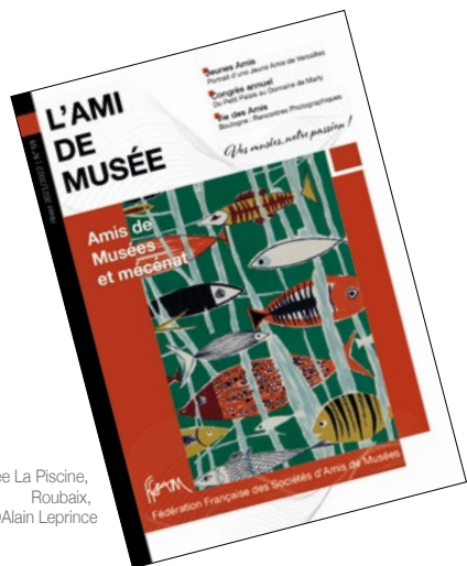
Musée La Piscine, Roubaix, ©Alain Leprince

Être membre de la FFSAM c'est appartenir à un réseau d'Amis de Musées, créer des liens et échanger sur les actions et expériences des uns et des autres, au niveau régional, national et international.